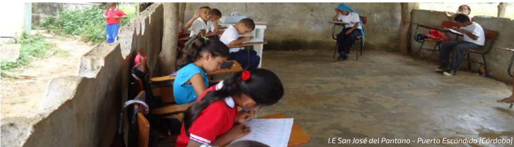
I.E San José del Pantano - Puerto Escondido [Córdoba]

La Comisión estará bajo el liderazgo del Ministerio de Hacienda y Crédito Público y el Departamento Nacional de Planeación, y harán parte de ella: el Ministerio de Educación Nacional, el Ministerio de Salud y Protección Social, el Ministerio de Vivienda, Ciudad y Territorio, el Ministerio del Interior, la Federación Colombiana de Trabajadores de la Educación , la Federación Colombiana de Municipios, Asocapitales y la Federación Nacional de Departamentos, agremiaciones, organizaciones y sectores sociales involucrados en las transferencias del Sistema General de Participaciones.